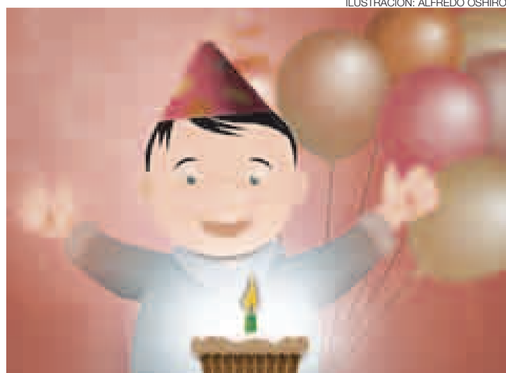
ILUSTRACIÓN: ALFREDO OSHIRO

sobre todo, los padres son los interesados en que la fiesta se celebre a lo grande. Es importante que ellos reflexionen sobre si la fiesta satisface sus necesidades personales o la de sus hijos, pues los niños de esta edad no recuerdan su primer cumpleaños y en algunos casos no lo disfrutaron. Es mejor hacerles una reunión pequeña, pero significativa, para invertir luego, en una edad en