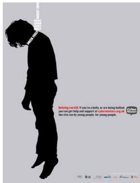
En su fase severa puede provocar suicidio.