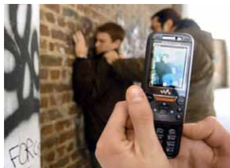
Redes sociales y you tube también golpean.

Fuente: Amemiya, I., Oliveros, M., & Barrientos, A. (2009)