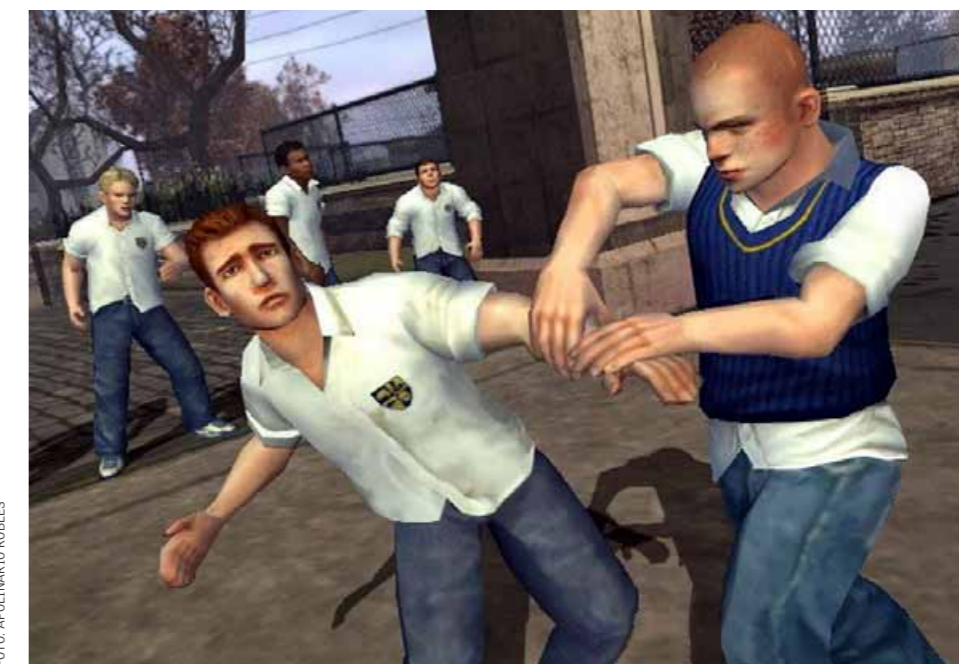
Esto no es juego. "Bully: Scholarship edition", versión Wii se vende en Polvos Azules.

A principios de noviembre un joven de 15 años murió atacado por otro de 14. En los colegios privados la agresión no suele ser física, pero los ataques psicológicos pueden ser más dolorosos.